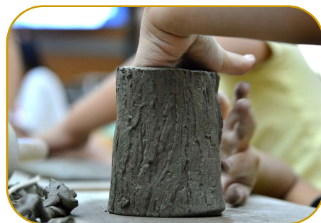
Modelage avec Lou LEMOINE