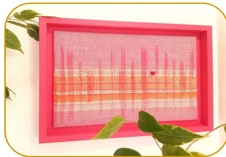
Tissage avec Angélique ZRAK